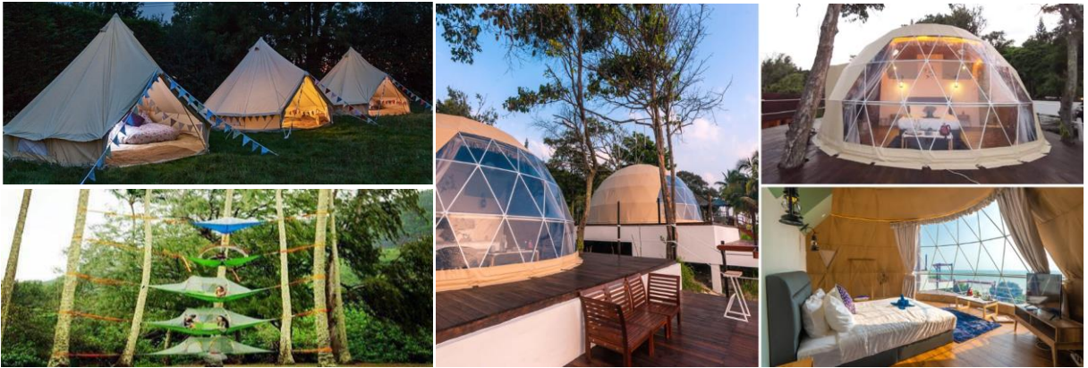
Foto: Penanda Aras Glamping 'Canopy Tribes' Kota Tinggi dan 'Cliffside Glamping' di Resort Sea Horizon, Kota Tinggi. Glamping Sedia ada sebagai pilihan penginapan oleh beberapa pemilik resort sedia ada.