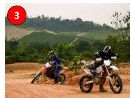
Ulu Choh Dirt Park, Kg. Melayu Ulu Choh, Kulai