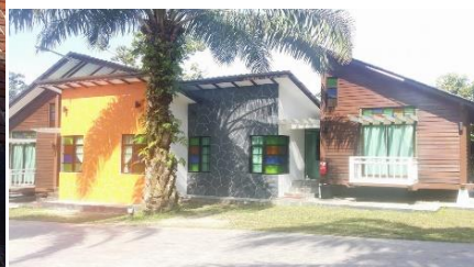
Foto: Taman Tema Desa berlatarbelakangkan Suasana Kelapa Sawit, di Lata Sri Pulai, Kg. Melayu Raya, Pontian dicadangkan untuk dinaiktaraf

Sumber: Kajian PHS Desa Negeri Johor (Fasa 1: Johor Selatan), 2019