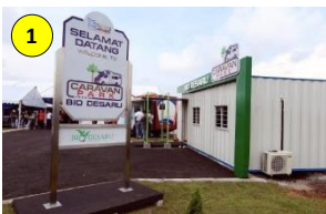
Bio-Desaru, Kota Tinggi