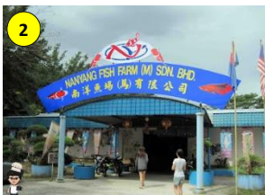
Nanyang Fish Farm, Kg. Ayer Bemban, Kulai