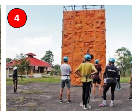
Otternest Camp Site, Kg. Sri Gunung Pulai II, Kulai