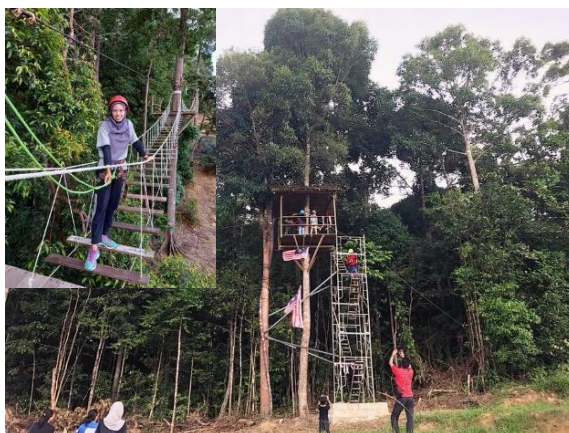
Foto: Taman Pelancongan Ekstrem Berlatarkan Hutan Dan Suasana Kampung, Di RAF Point, Kg. Lukut, Kota Tinggi Dicapadangkan Untuk Dinaiktaraf