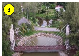
Taman Rekreasi Pantai Rambah, Kg. Rambah, Pontian