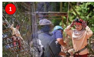
RAF Point, Kg. Lukut, Kota Tinggi