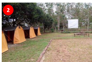
Villaggio Easy Camping (VECAMP), Kg. Temenin, Kota Tinggi