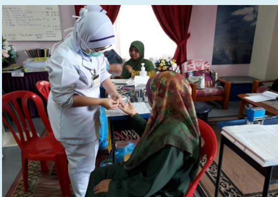
Foto: Pemeriksaan Kesihatan Masyarakat Desa