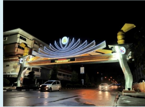
Foto: Pintu Gerbang Ketengah, Terengganu