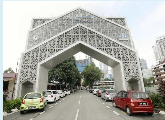
Foto: Pintu Gerbang Kampung Baru, Kuala Lumpur