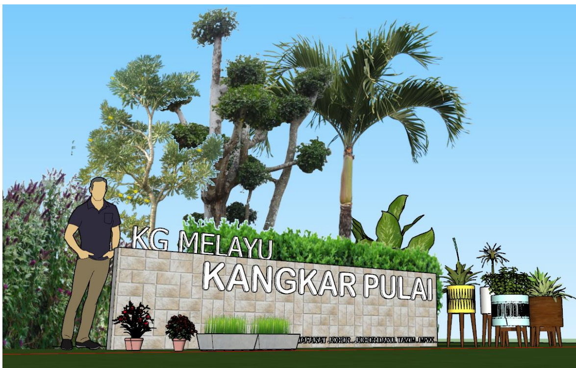
Foto: Contoh Cadangan Rekebentuk Mercu Tanda