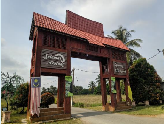
Foto: Pintu Gerbang Kampung Lonek, Negeri Sembilan