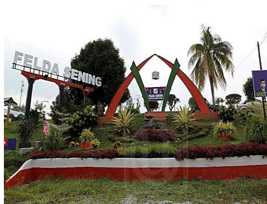
Foto: Mercu Tanda Felda Sening, Kota Tinggi