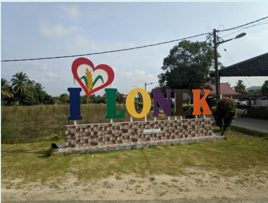
Foto: Mercu Tanda Kampung Lonek, Negeri Sembilan