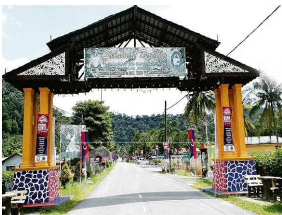
Foto: Pintu Gerbang di Kampung Sri Gunung Pulau sebagai pintu keluar dan masuk ke kampung.