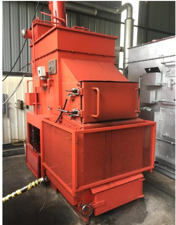
Foto: Penggunaan Teknologi The Asher Sebagai Salah Satu Alternatif Pengurusan Sisa Pepejal Sumber: Laman Web Cilsos , 2019

Sumber: Kajian PHS Desa Negeri Johor (Fasa 1: Johor Selatan), 2019