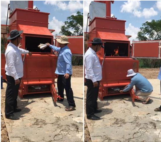
Foto: Proses Pyrolysis dengan Menggunakan The Asher

Selain itu, dicadangkan juga penggunaan teknologi moden seperti The Asher bagi mengurangkan risiko pencemaran alam sekitar sekaligus mempertingkatkan kualiti dan kesejahteraan hidup penduduk. Penggunaan alternatif dijangka dapat menyelesaikan masalah pembuangan sampah di beberapa kampung terpilih di samping berpotensi untuk menjana hasil dan produk tambahan melalui teknologi ini.