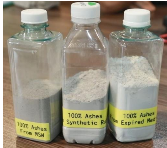
Foto: Pengklasifikasi Ash bagi Kegunaan Berbeza