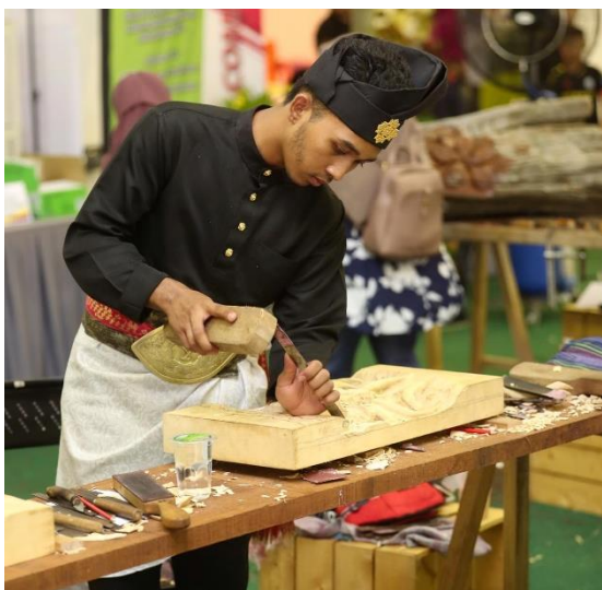
Foto: Pertandingan Ukiran Kayu di Festival Kraf Johor