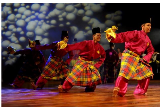
Foto: Antara sukan tradisional yang perlu dipelihara