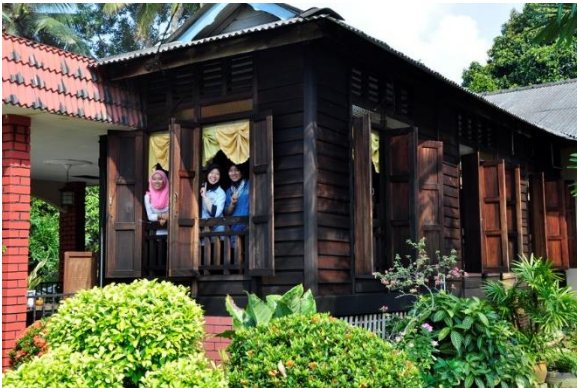
Foto: Homestay Kampung Temenin Baru, Kota Tinggi