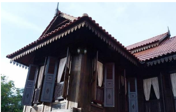
Foto: Rumah Seri Salewangeng, Kg. Sungai Kual