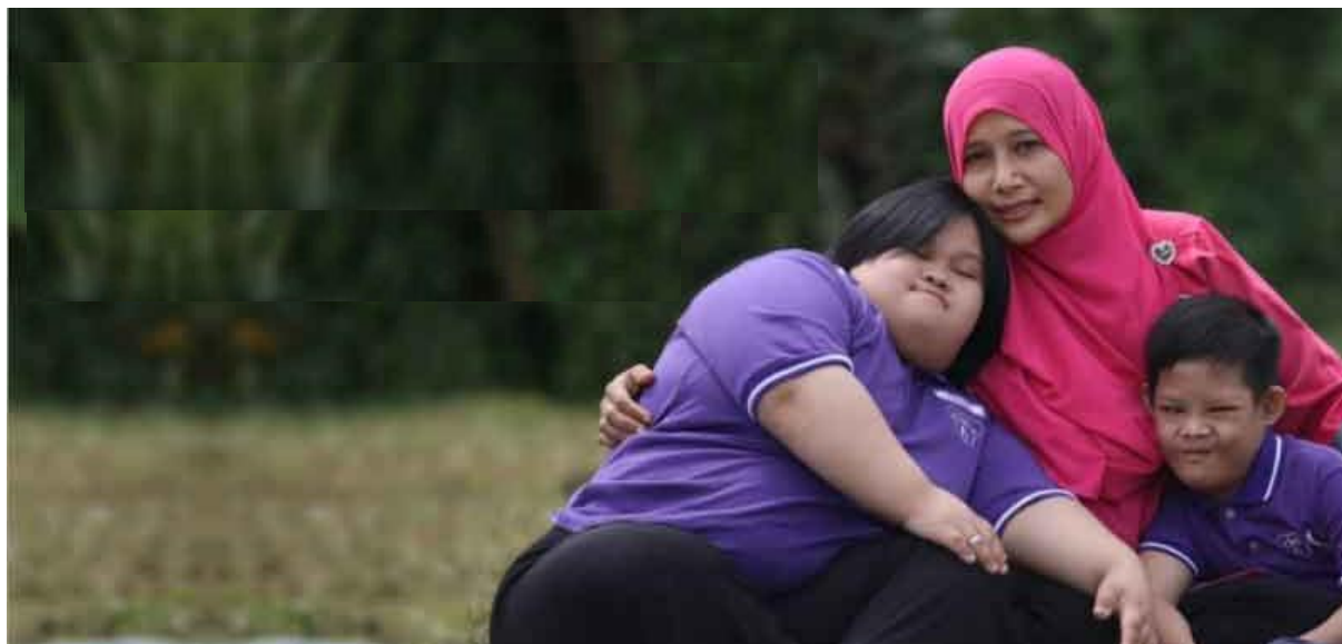
Foto: Aktiviti Sosial Bagi Tujuan Pemulihan dan Rawatan Golongan OKU