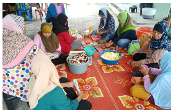
Foto: Aktiviti rewang dapat mengukuhkan perpaduan masyarakat