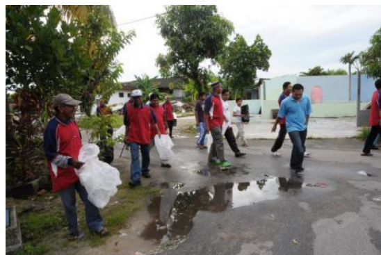
Foto: Aktiviti gotong royong di Kg Melayu, Johor Bahru

Rewang lebih menjurus kepada aktiviti yang dilakukan bersama-sama dalam bentuk kumpulan agak besar secara bergotong royong untuk menguruskan sesuatu majlis atau kenduri. Amalan yang sememangnya terkenal dalam masyarakat kampung ini mempunyai pelbagai manfaat selain daripada mewujudkan sikap kerja sama dan tolong menolong.