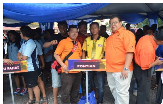
Foto: Liga sukan melibatkan semua daerah di Johor