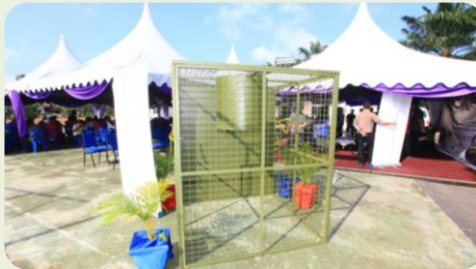
Foto: Contoh perangkap kera bersaiz 8'x8'x8'.

Sumber: Laman Rasmi Jabatan PERHILITAN, Program Kesejahteraan Rakyat Kawalan Gangguan Hidupan Liar