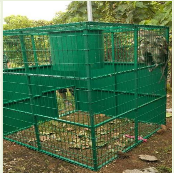
Foto: Jabatan PERHILITAN memperuntukkan kemudahan perangkap kera bagi memudahkan proses pemindahan dan penangkapan.