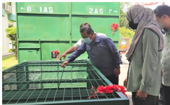
Foto: Penyerahan perangkat kera Jabatan PERHILITAN merupakan inisiatif kerajaan dalam pengurusan konflik manusia-hidupan liar yang sering menimbulkan konflik samada di kawasan penempatan atau kebun tanaman bagi menjamin kesejahteraan rakyat.