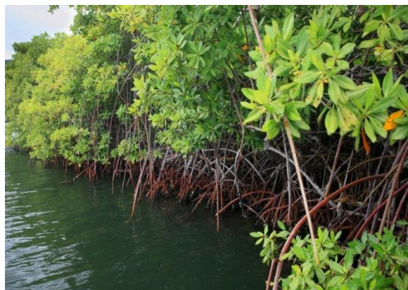
Foto: Libatsama dalam usaha pemeliharaan kawasan Eko - Pelancongan warisan seperti Hutan Lipur Gunung Pulai.