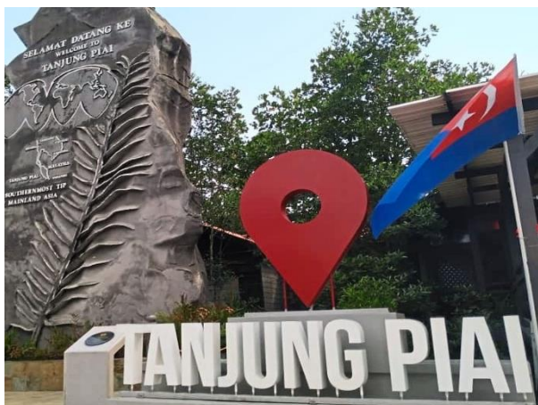
Foto: Taman Negara Tanjung Piai.